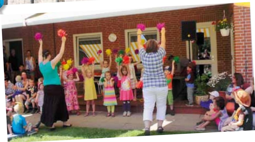
Wilder Westen in der Kita „Arche Noah“

Und dann war ja auch noch die Fußball-WM an diesem Tag, Viertelfinale, Deutschland-Frankreich – so haben wir pünktlich aufgehört, rucki-zucki aufgeräumt und erfolgreich die Daumen gedrückt!